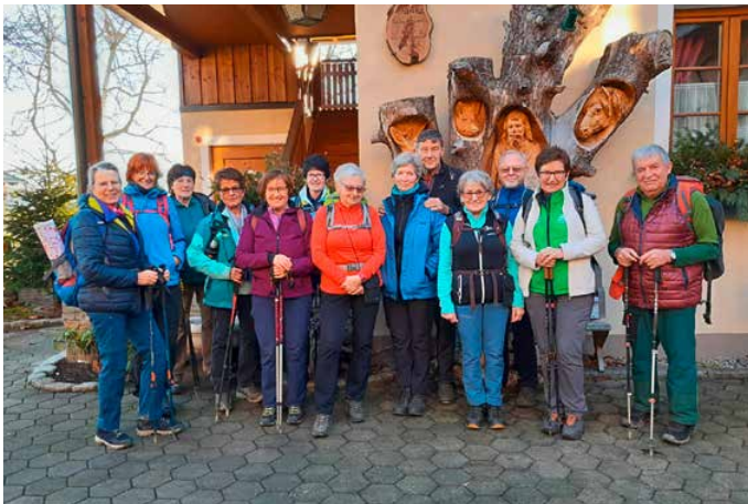
▲ Die Silvester-Wandergruppe vor dem Gh. Langthaler

Nun ein paar Details zum Streckenverlauf, falls Leser unserer Zeitung diese Wanderung mit Rast im gemütlichen Landgasthaus Langthaler (vorzügliche Küche) auch gehen wollen. Unser Ausgangspunkt war in Emmersdorf-Hofamt. Von wo wir alsbald auf einsamen Wegen in den südlichen Rand des Naturparks Jauerling eintauchten. Zuerst ging es ein kleines Stück auf einem schmalen Steig bergauf, aber bald wurde der Weg breiter und wir konnten diesen gemütlich über Mödelsdorf und Fahnsdorf bis zur Hubertuskapelle fortsetzen. Als wir dort ankamen waren wir etwa zwei Stunden gewandert und es wurde höchste Zeit unsere selbst gemachten Kekse, Liköre und Schnäpse zu verkosten. Zum Gasthaus war es von da weg kaum noch eine 1/2 Stunde.